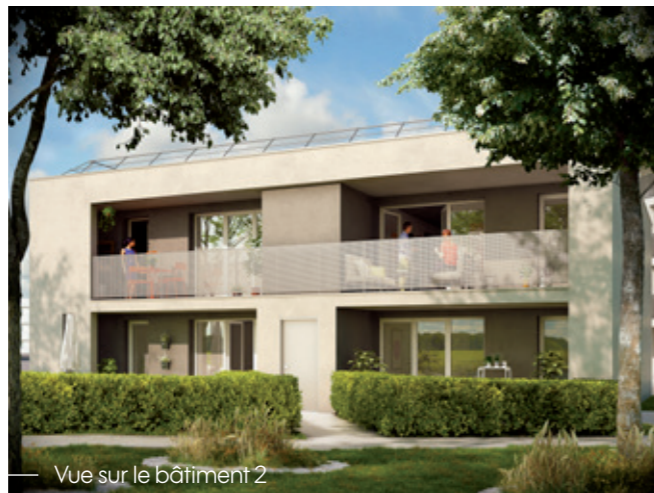
Vue sur le bâtiment 2