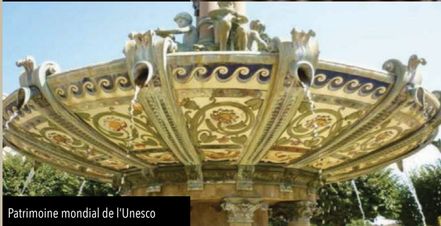
Patrimoine mondial de l'Unesco