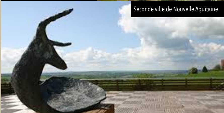
Seconde ville de Nouvelle Aquitaine