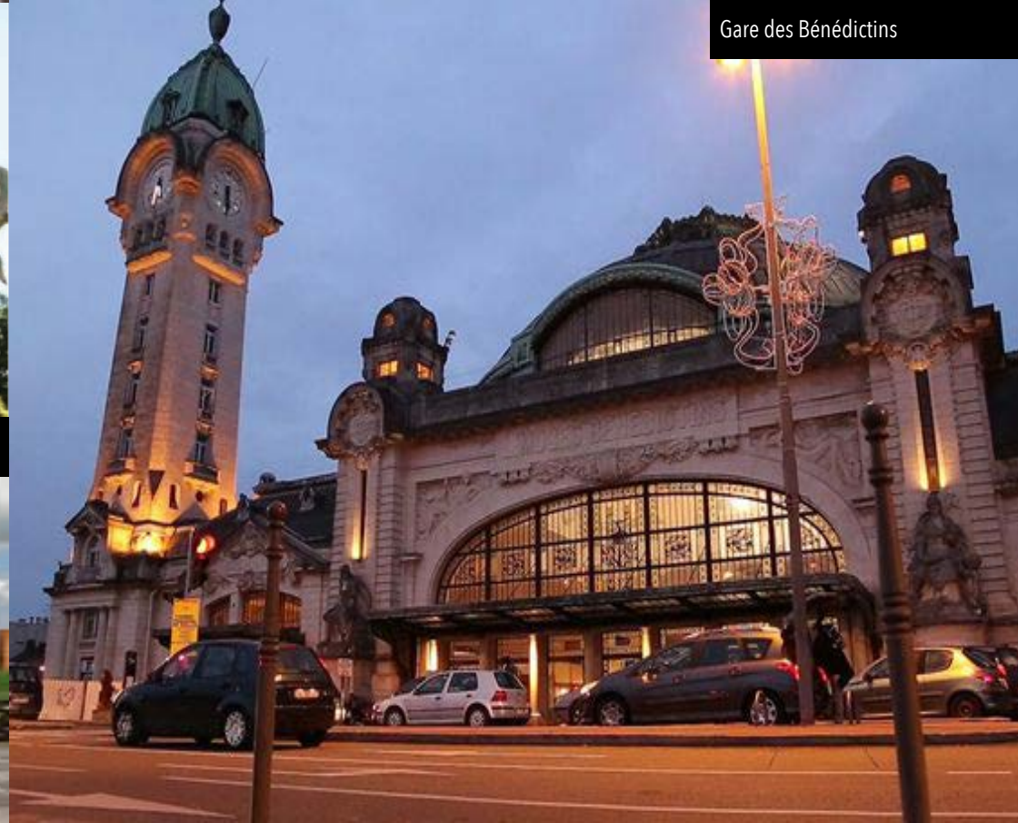
Gare des Bénédictins