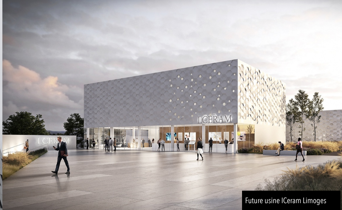
Future usine ICeram Limoges