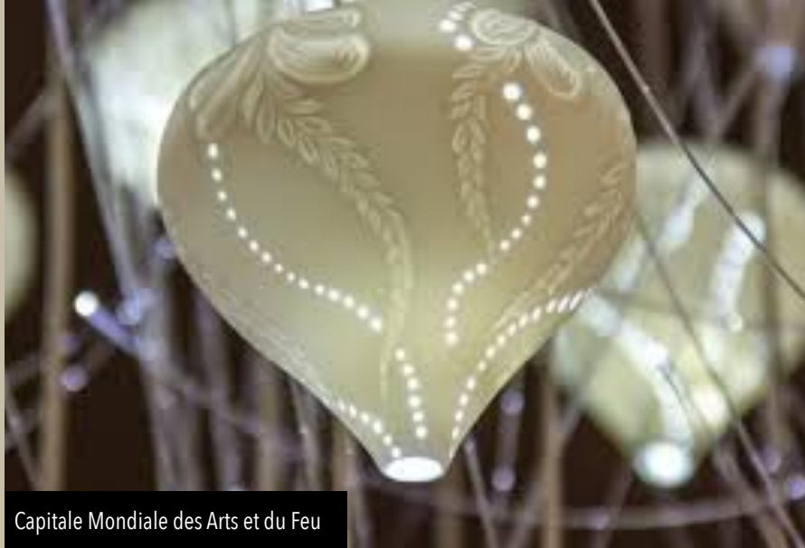
Capitale Mondiale des Arts et du Feu