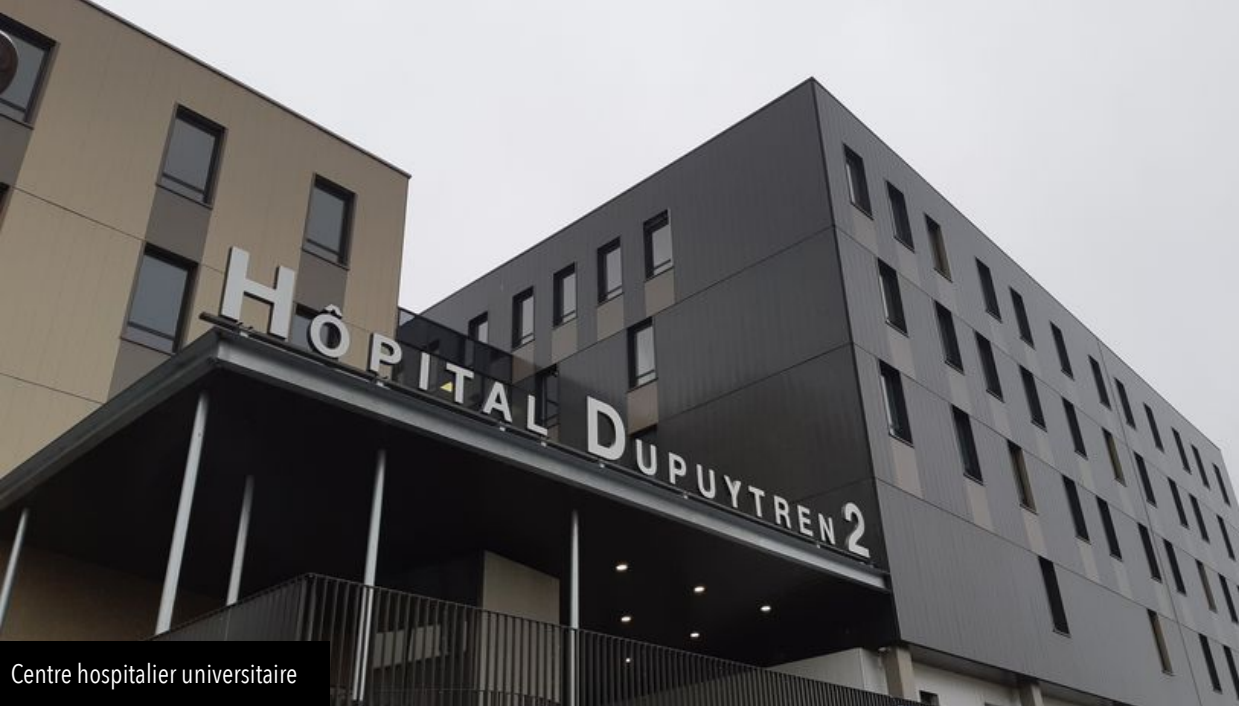
Centre hospitalier universitaire